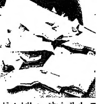
اوراق ضبطت مع المنبارين قبل دخولهم